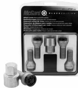
Black Edition låsbult