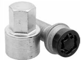
Black Edition låsbult