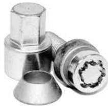
PCD Åndring låsbult