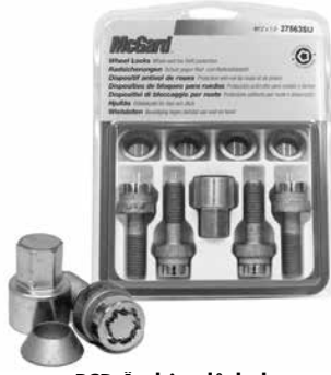
PCD Åndring låsbult