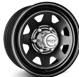
7. DOTZ Pharao Dark blank svart