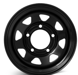
9. DOTZ Dakar Dark Extreme blank svart