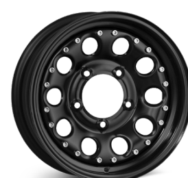
10. DOTZ Modular Beadlock (15") blank svart