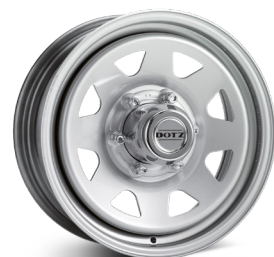
6. DOTZ Pharao silver