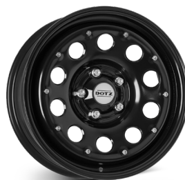
11. DOTZ Modular Beadlock (17") blank svart