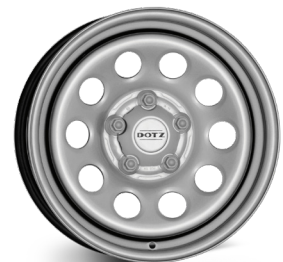
4. DOTZ Modular silver