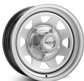
1. DOTZ Dakar silver

a) Köpa ZX9100S9 ingår i priset b) Köpa ZX9100B9 ingår i priset c) Köpa ZOD4S9 ingår i priset e) Köpa ZXZ100B9 ingår i priset