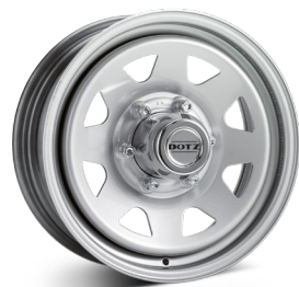
6. DOTZ Pharao silver