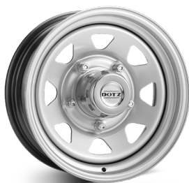
1. DOTZ Dakar silver

a) Priserna anges exkl. kåpa b) Priset är inklusive kåpa c) Ingen kåpa möjlig