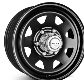
7. DOTZ Pharao Dark blank svart