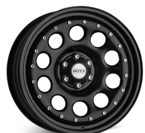
12. DOTZ Modular Beadlock (18") blank svart