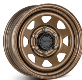
3. DOTZ Dakar Bronze brons