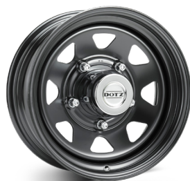
2. DOTZ Dakar Dark blank svart