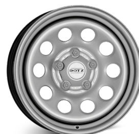
4. DOTZ Modular silver