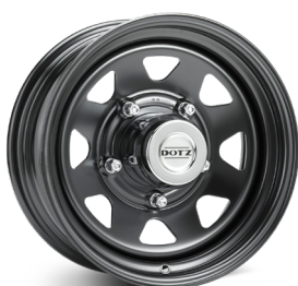
2. DOTZ Dakar Dark blank svart