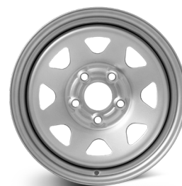
DOTZ Dakar trailer silver