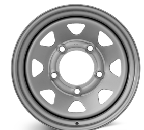
8. DOTZ Dakar Extreme silver