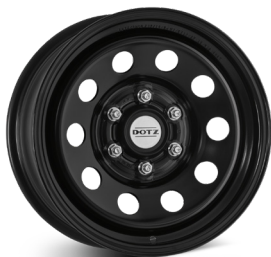
5. DOTZ Modular dark blank svart