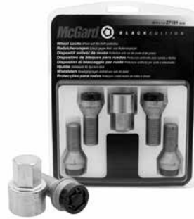
Black Edition låsbult